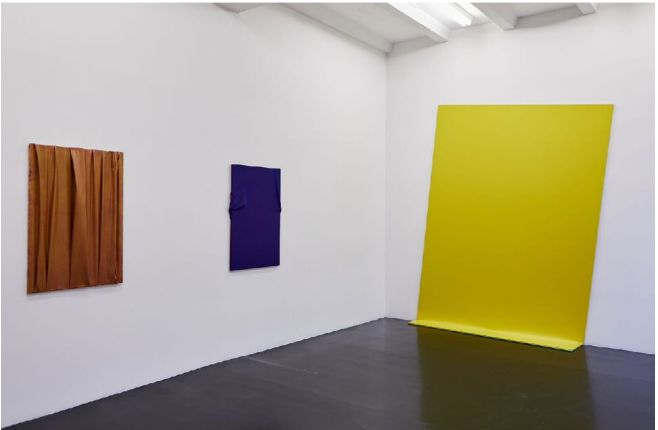
Ausstellungsansicht Exhibition view