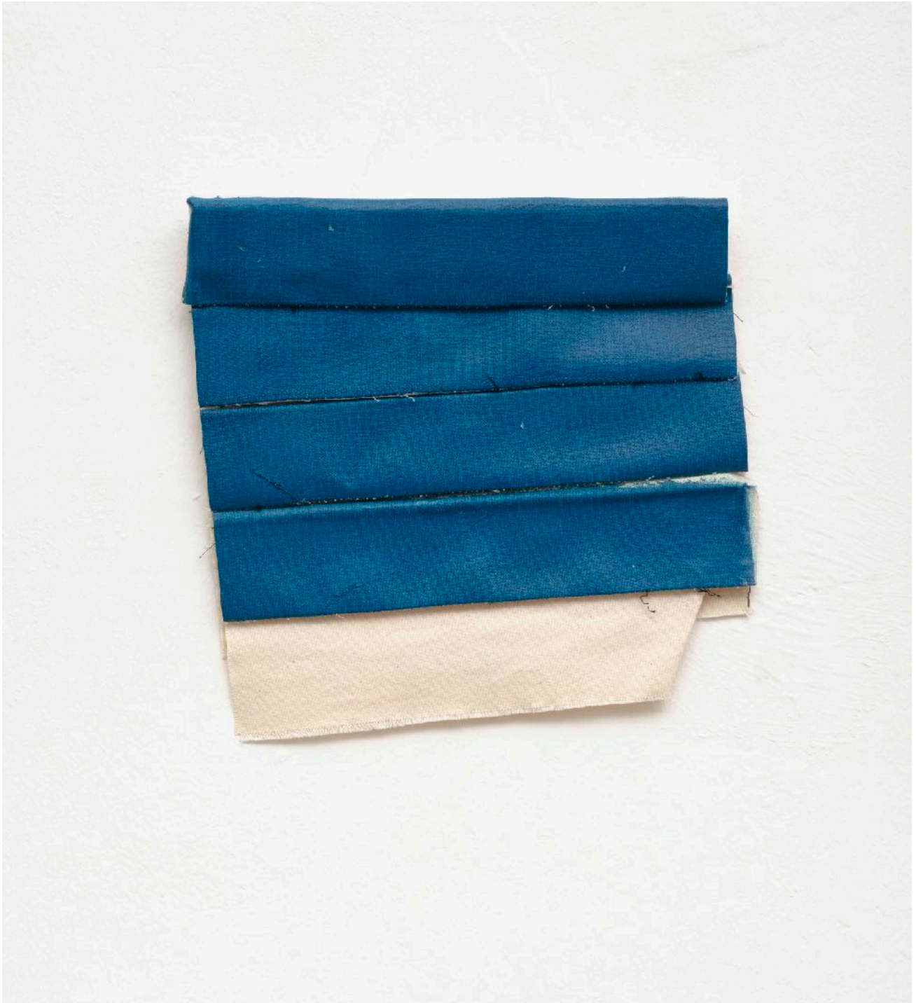
ohne Titel , 2016

Acryl auf Baumwolle, Garn / acrylic on cotton, yarn