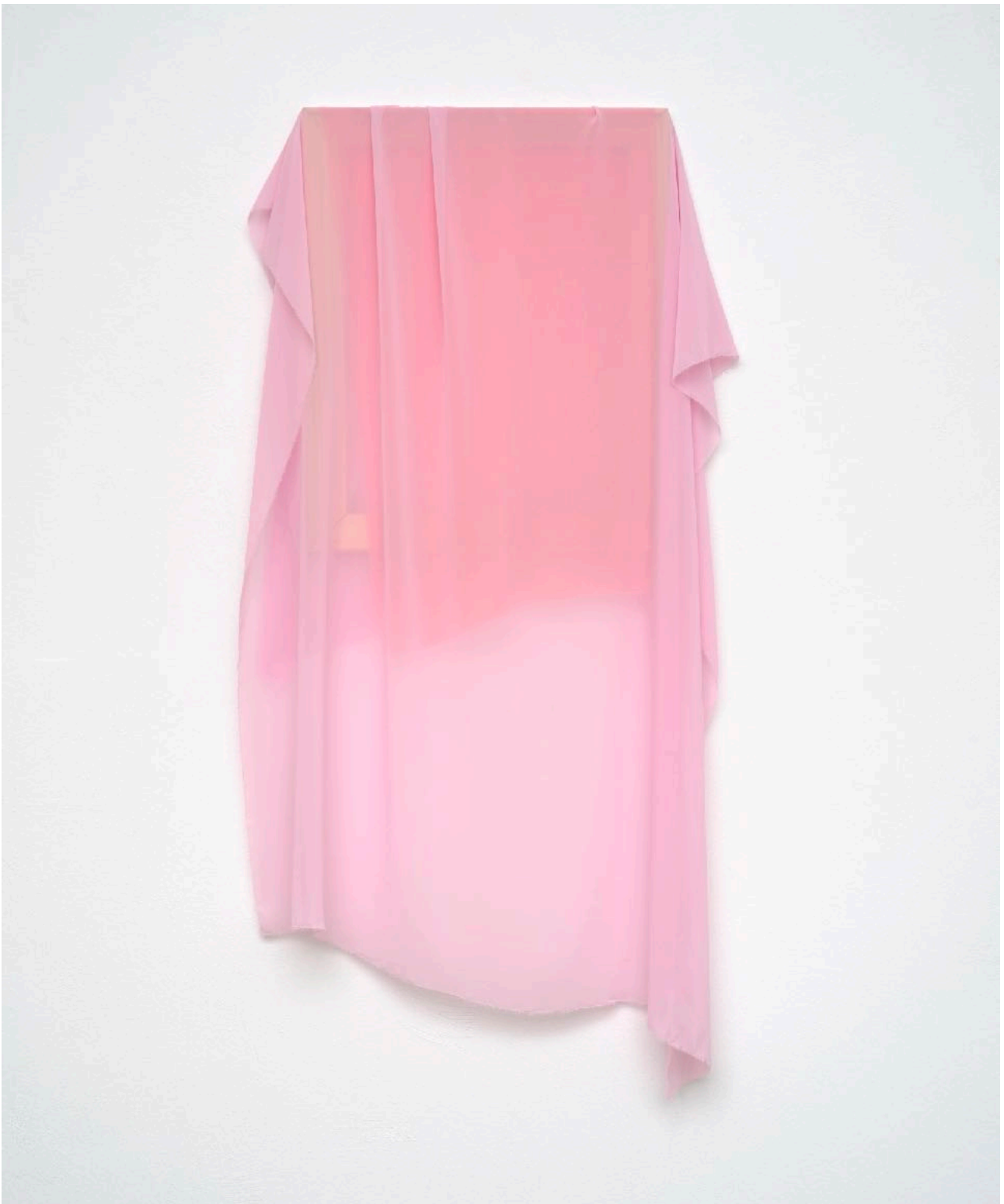
ohne Titel (047) , 2019