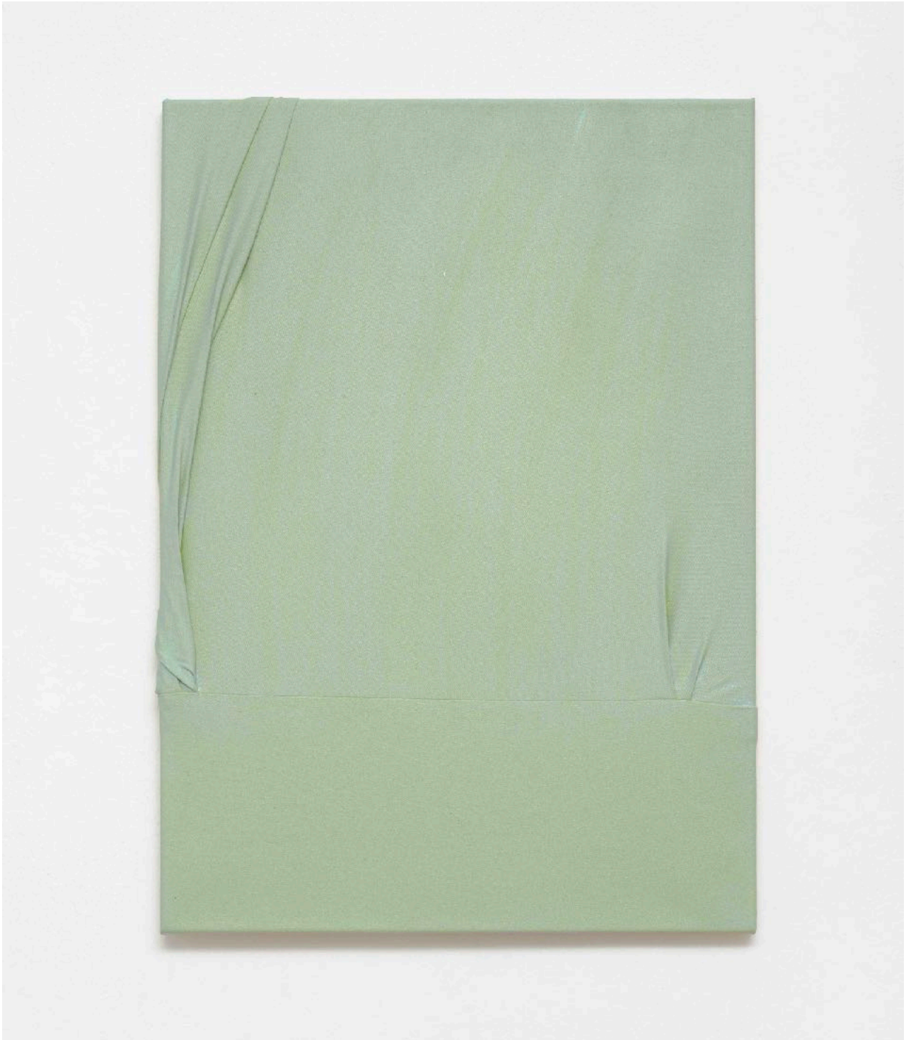
ohne Titel (012) , 2024

Acryl auf Baumwolle, Garn / acrylic on cotton, yarn