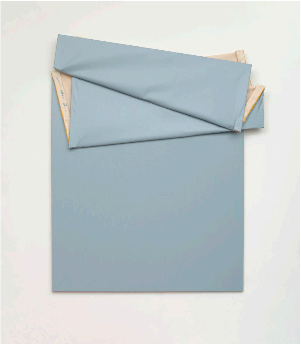
ohne Titel (034) , 2021