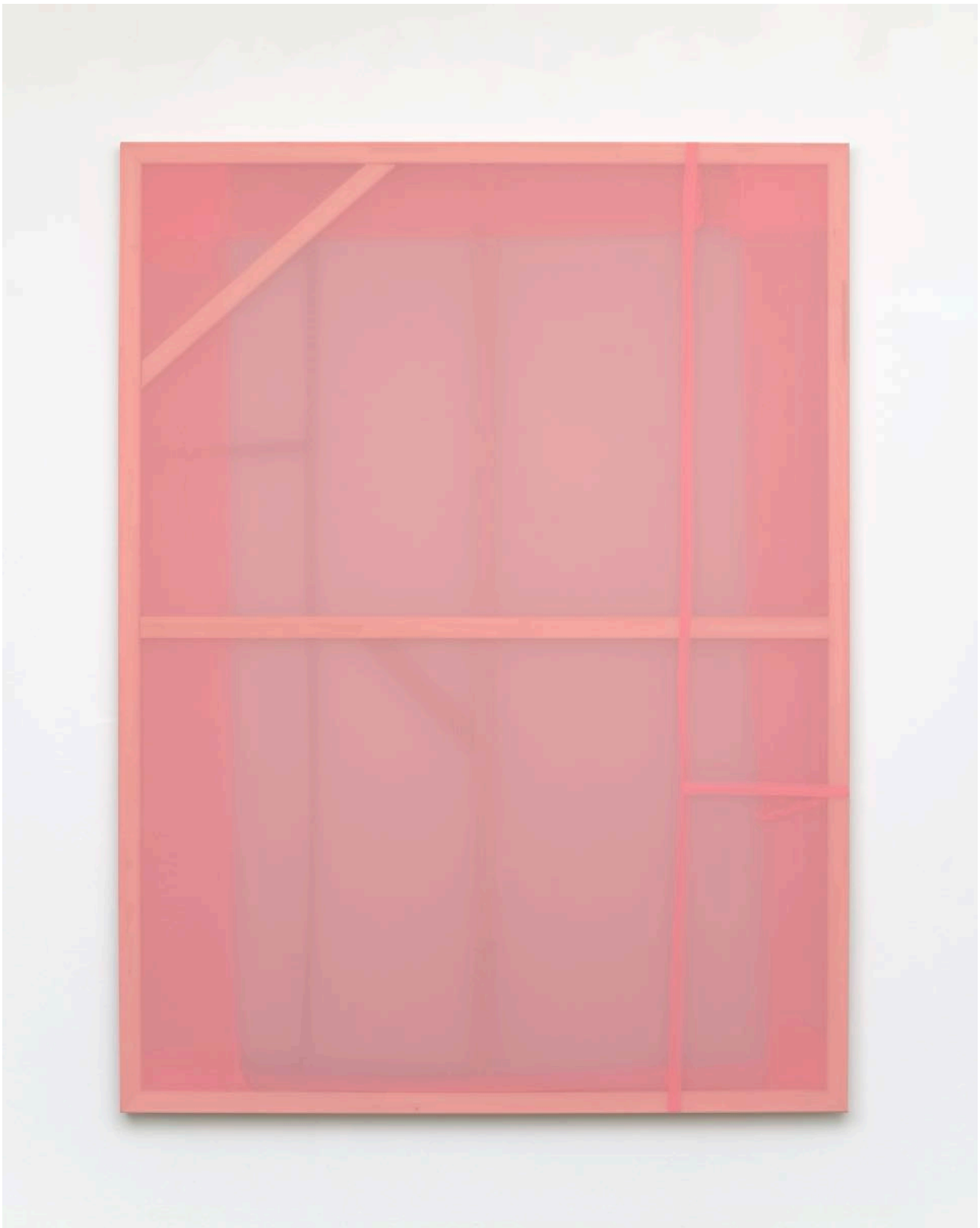
ohne Titel (071) , 2020 Chiffon, Garn / chiffon, yarn 200 x 150 x 4 cm