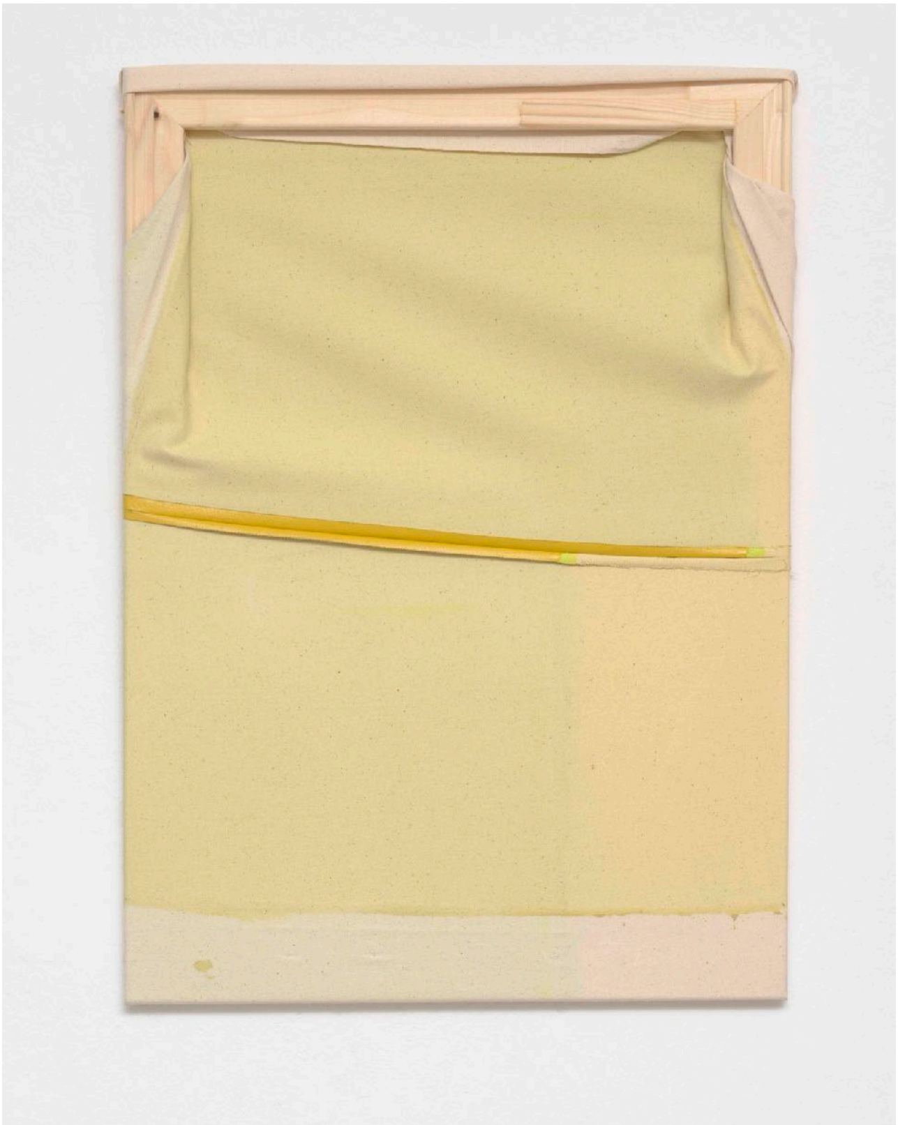
ohne Titel (041) , 2024

Acryl auf Baumwolle, Garn / acrylic on cotton, yarn