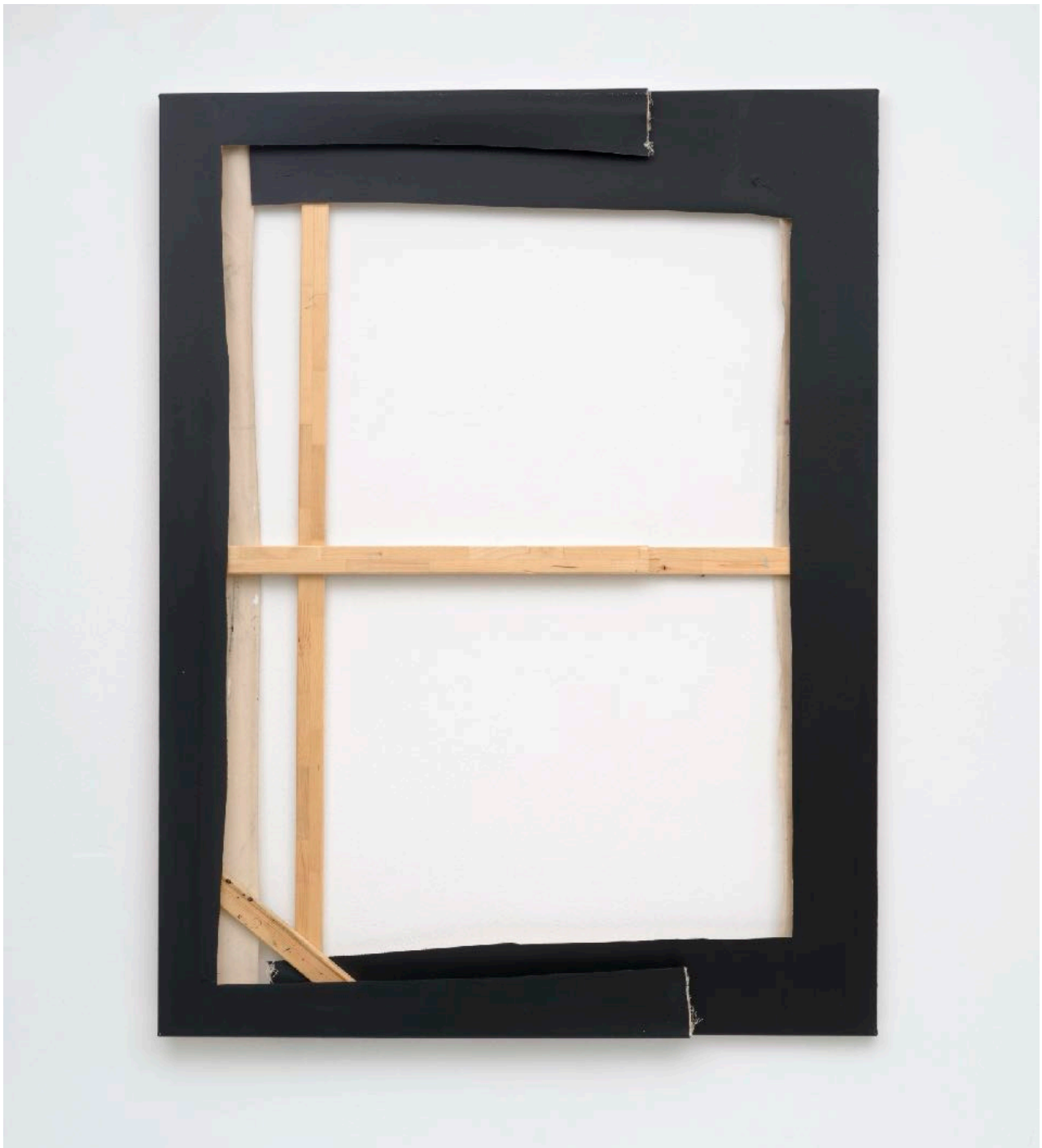
geordnete Reduzierung vormals unentschlüssener Farbgebung , 2014

Acryl und Lack auf Leinwand / acrylic and lacquer on canvas