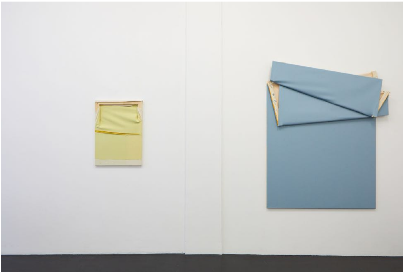
Ausstellungsansicht Exhibition view