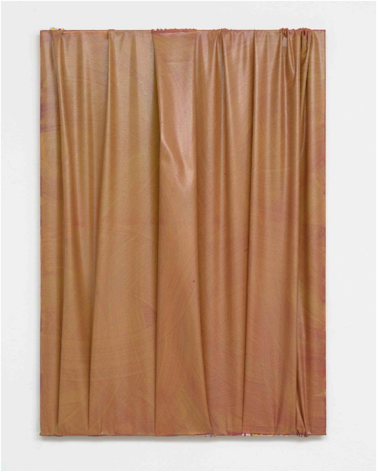
ohne Titel (051) , 2024