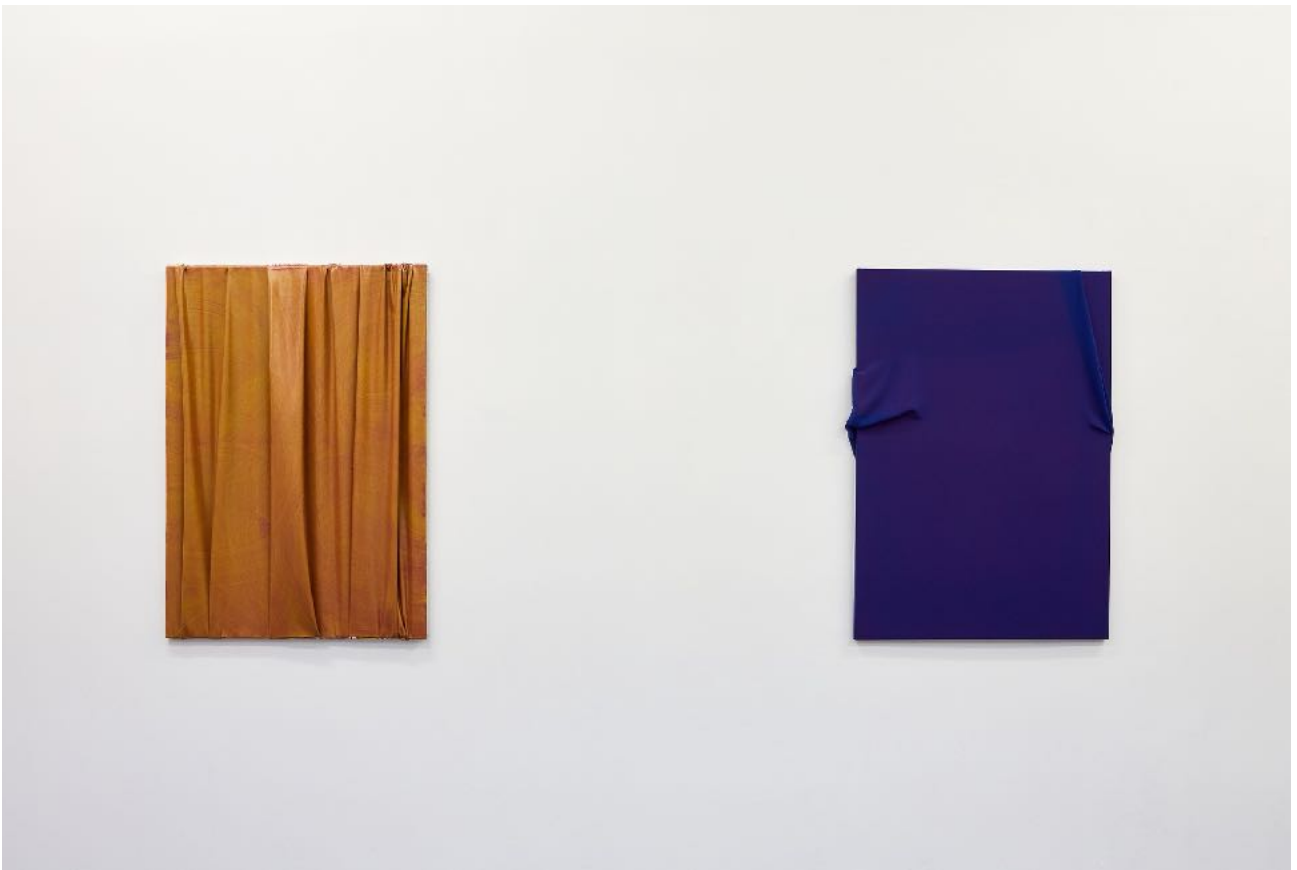
Ausstellungsansicht Exhibition view