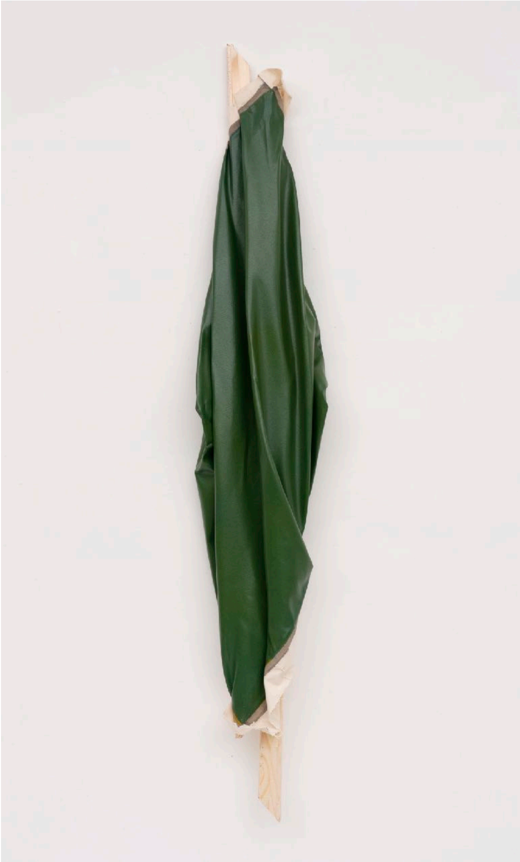
ohne Titel (079) , 2018