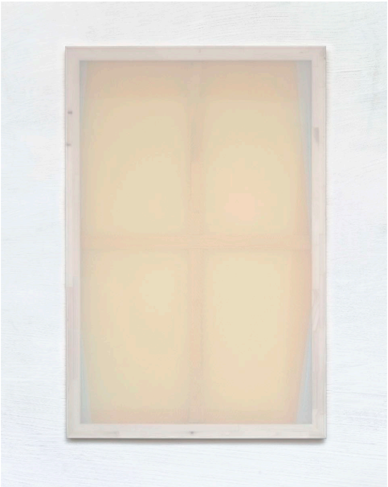
ohne Titel (003) , 2025