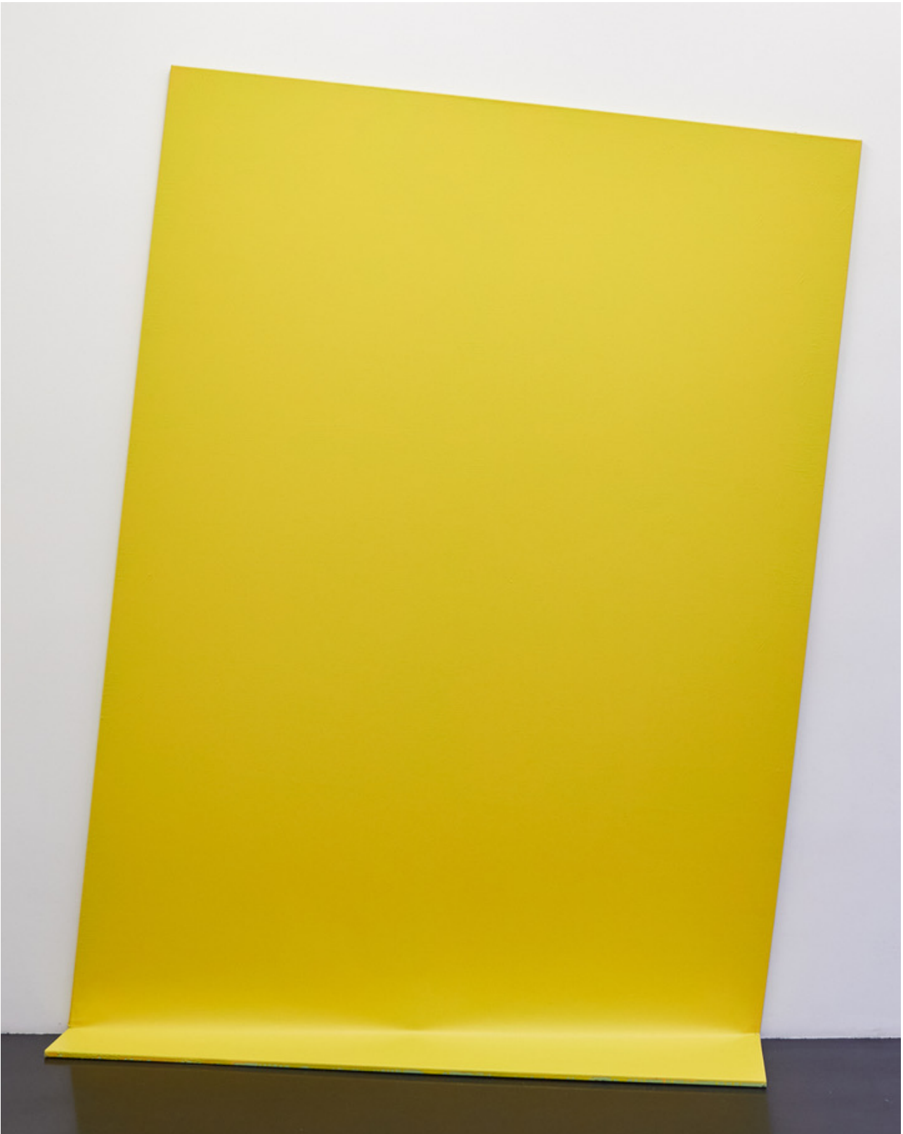
ohne Titel (059) , 2020

Acryl auf Leinwand / acrylic on canvas 300 x 200 cm