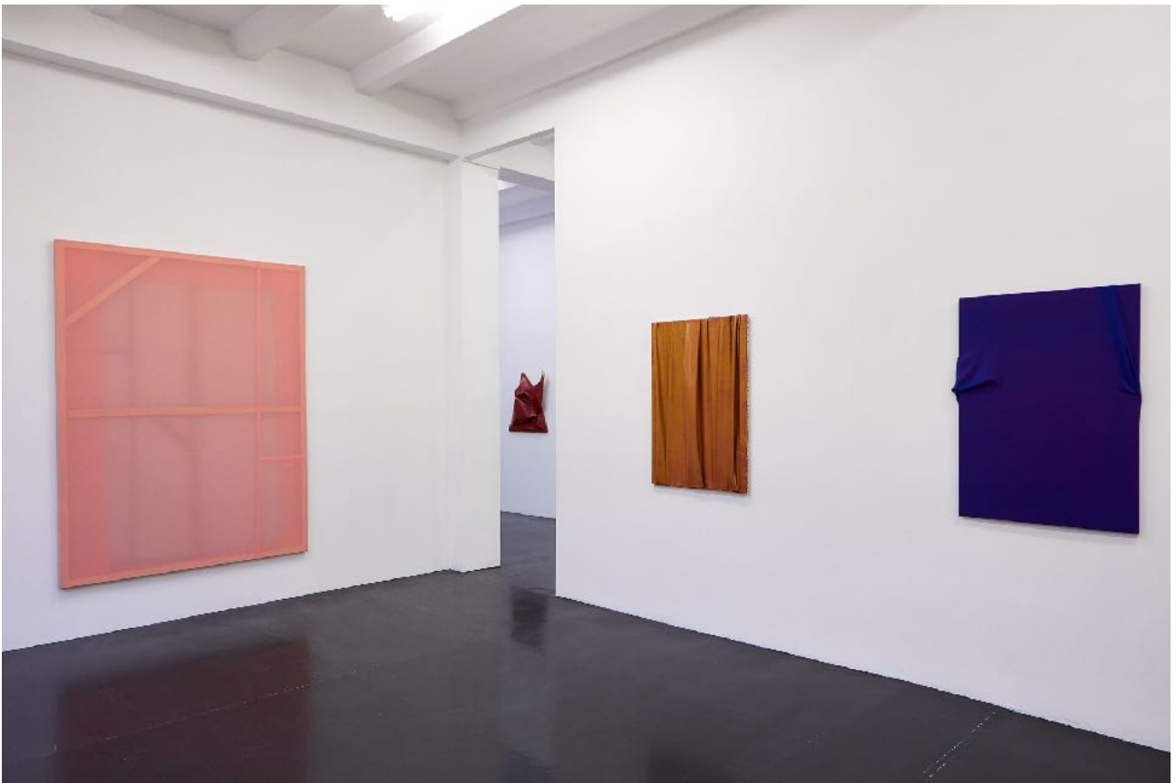
Ausstellungsansicht Exhibition view