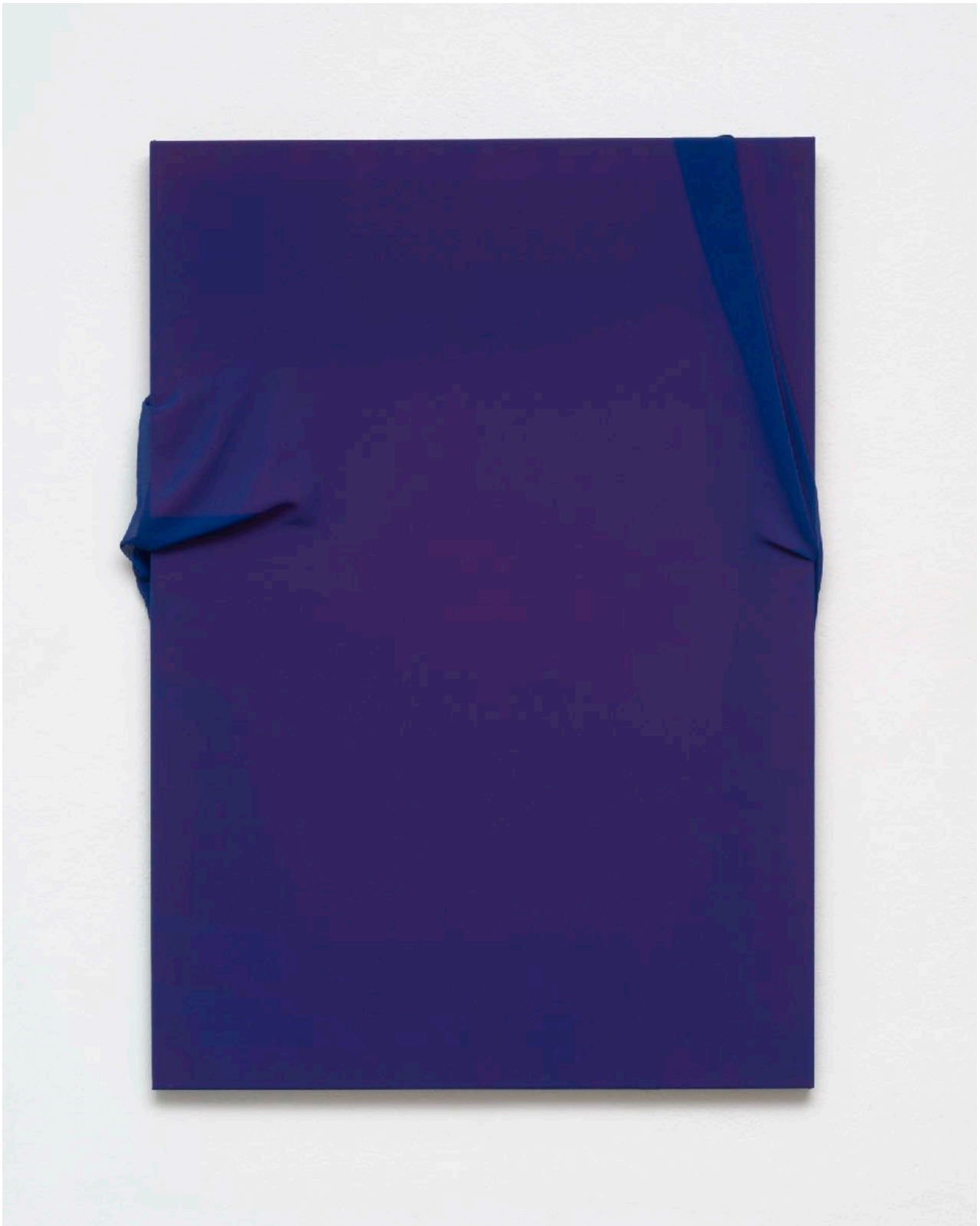
ohne Titel (056) , 2024