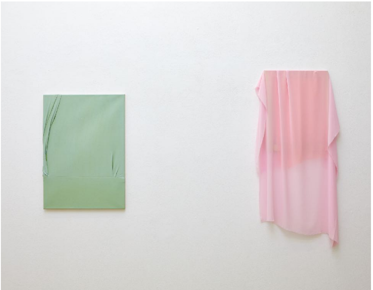
Ausstellungsansicht Exhibition view