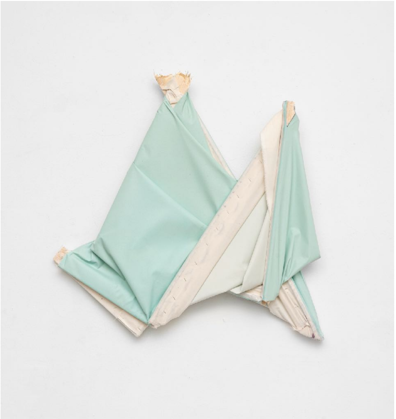
ohne Titel (Zelt) , 2019