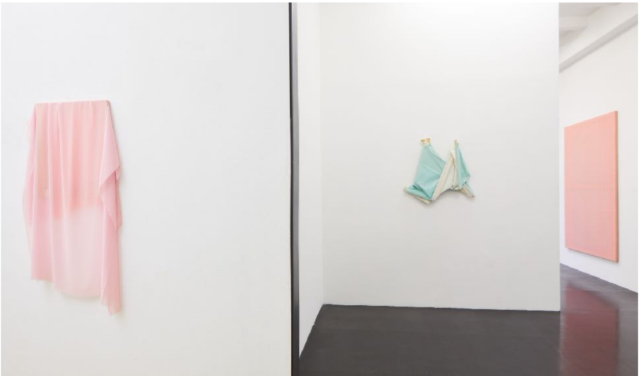
Ausstellungsansicht Exhibition view