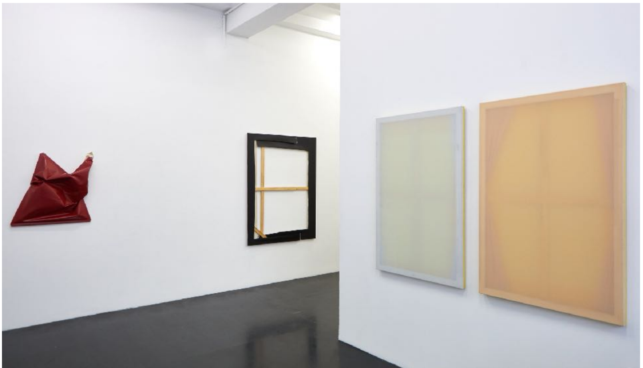
Ausstellungsansicht Exhibition view