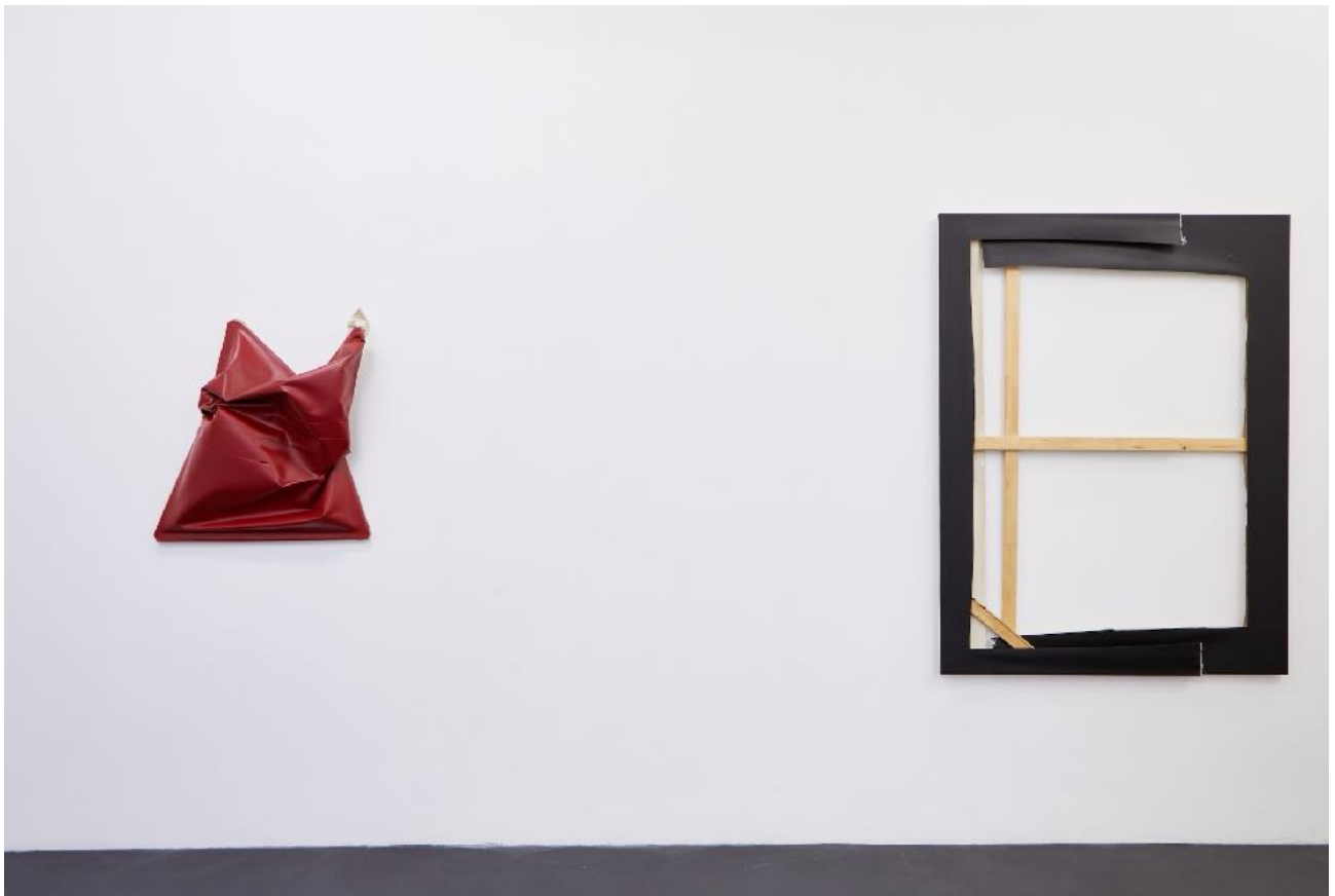
Ausstellungsansicht Exhibition view