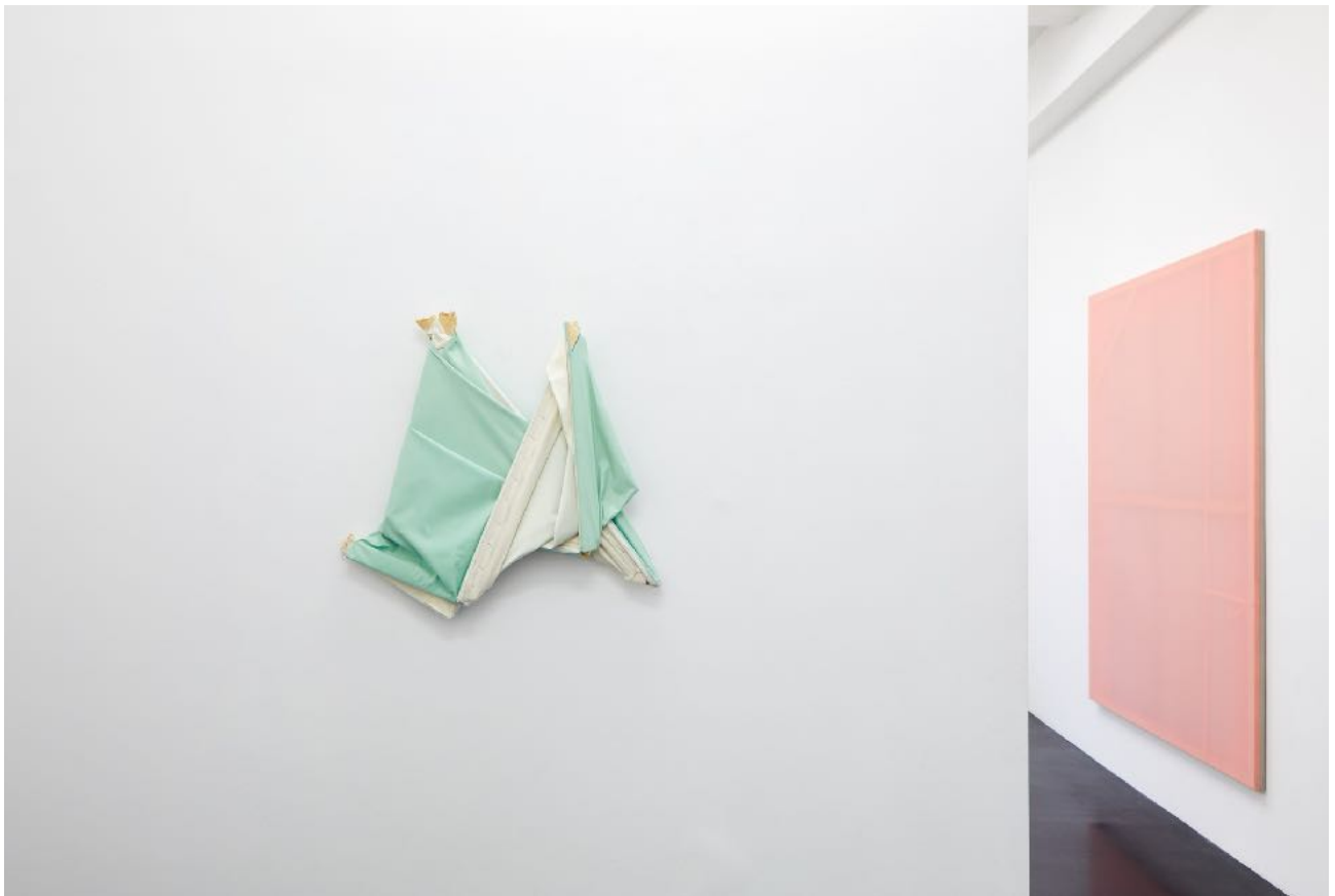
Ausstellungsansicht Exhibition view