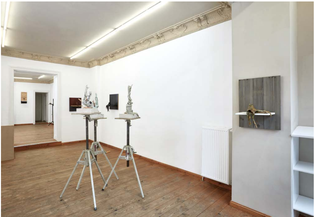
Ausstellungsansicht Exhibition view