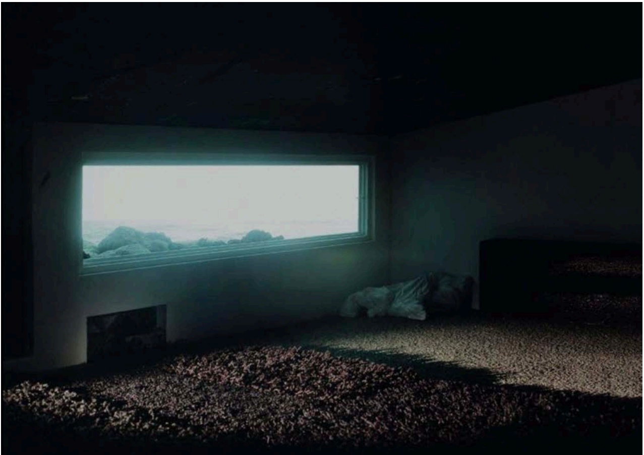
Raum V , 2010