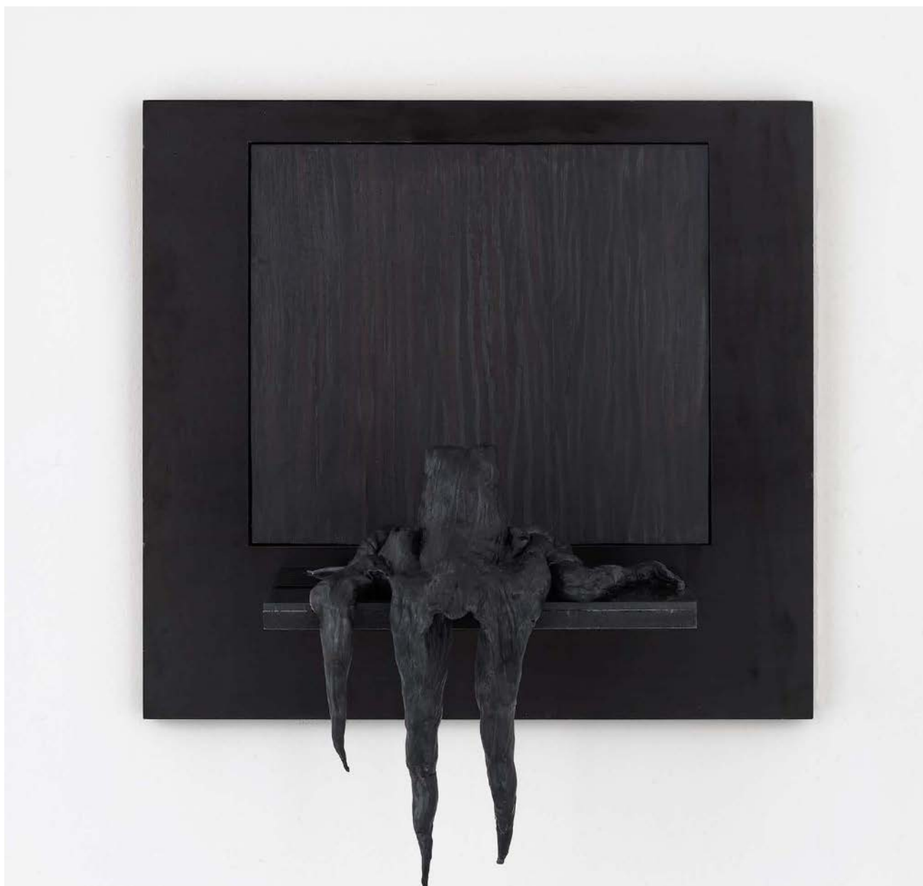
Schwarzer Krake , 2023