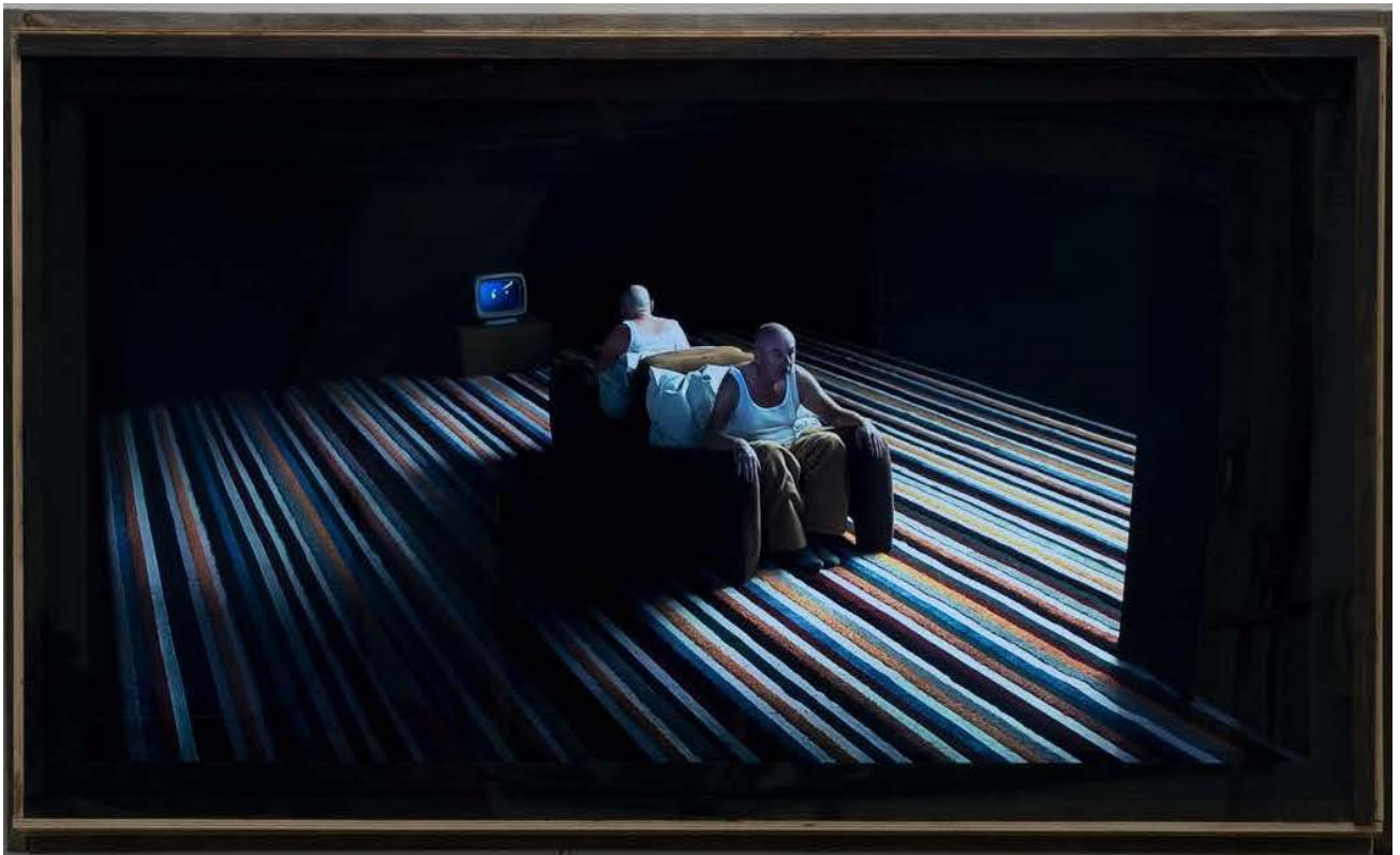
Glückselige Männer , 2016

HD Film mit Unikatgehäuse , Videoloop 13 min / HD film with unique case, video loop 13 min