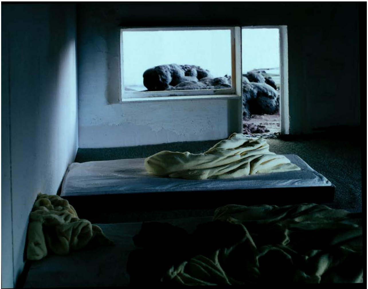
Raum VI , 2010