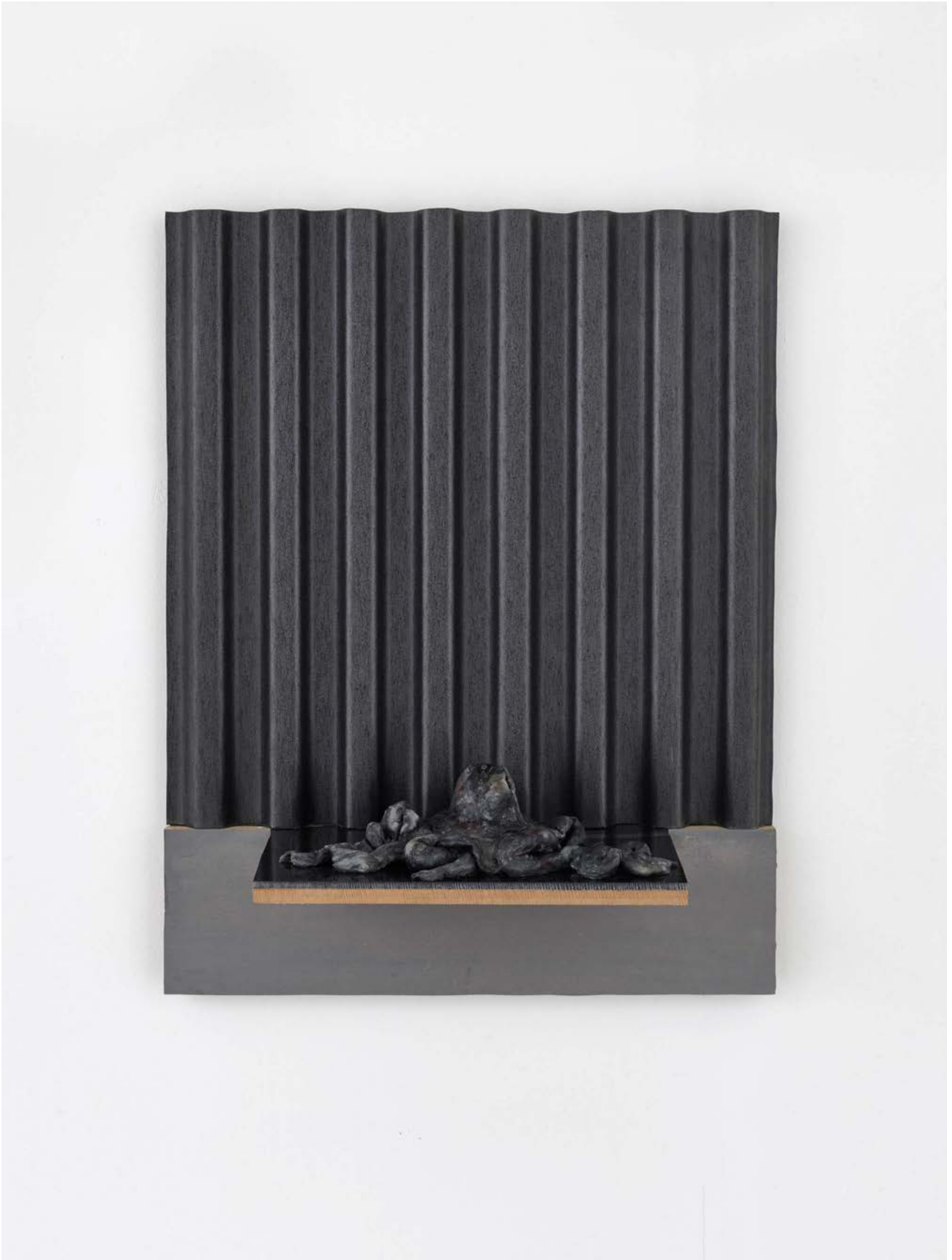
Krake vor Wellblech , 2023