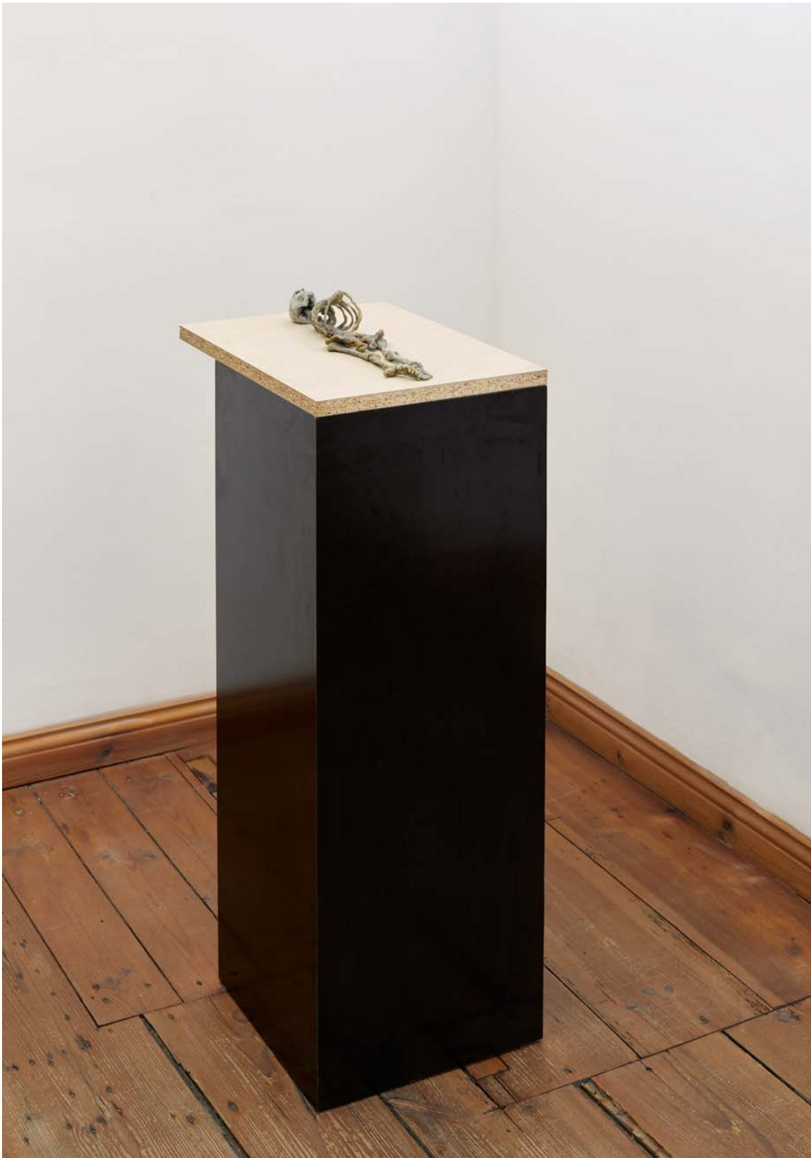
Kleines Skelett , 2023

Bienenwachs, Spanplatte, Sockel / beeswax, chipboard, base