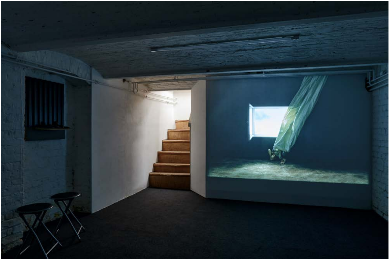
Ausstellungsansicht Exhibition view