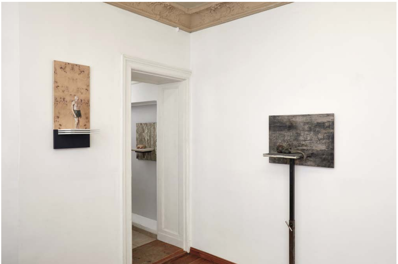
Ausstellungsansicht Exhibition view