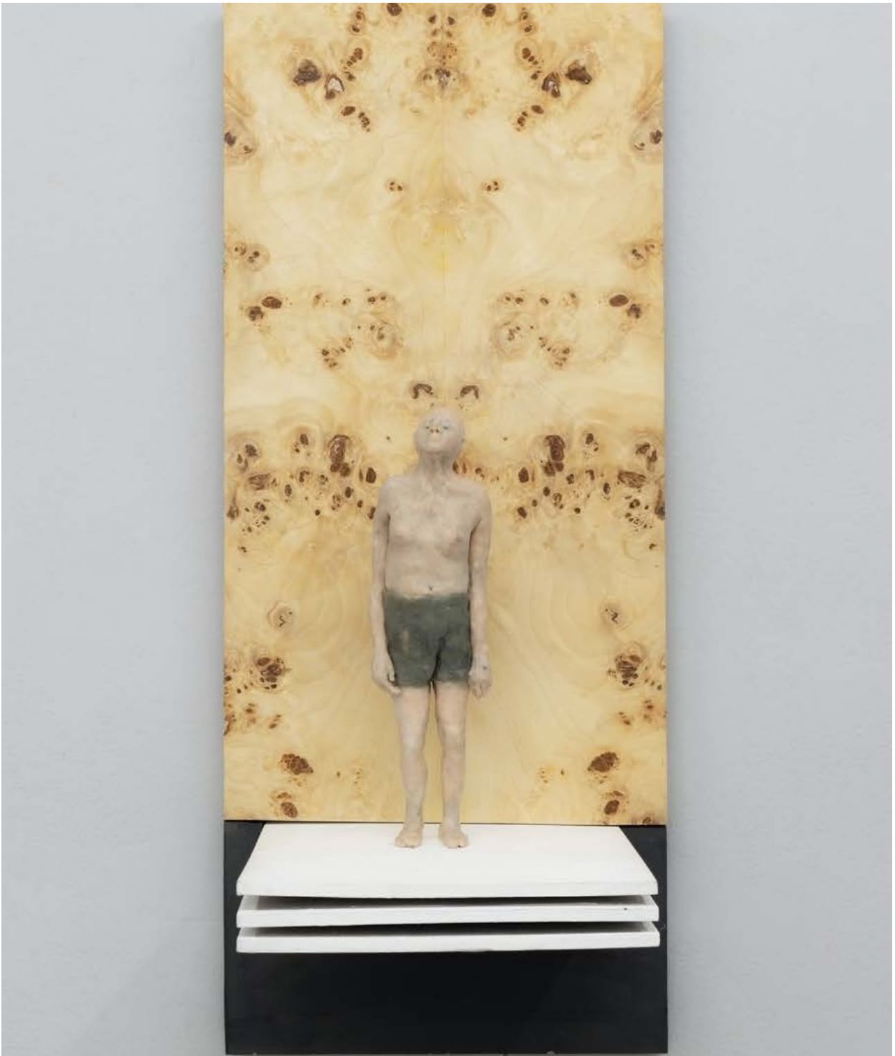
Stehender Mann , 2023

Bienenwachs, Holzfurnier / beeswax, wood veneer