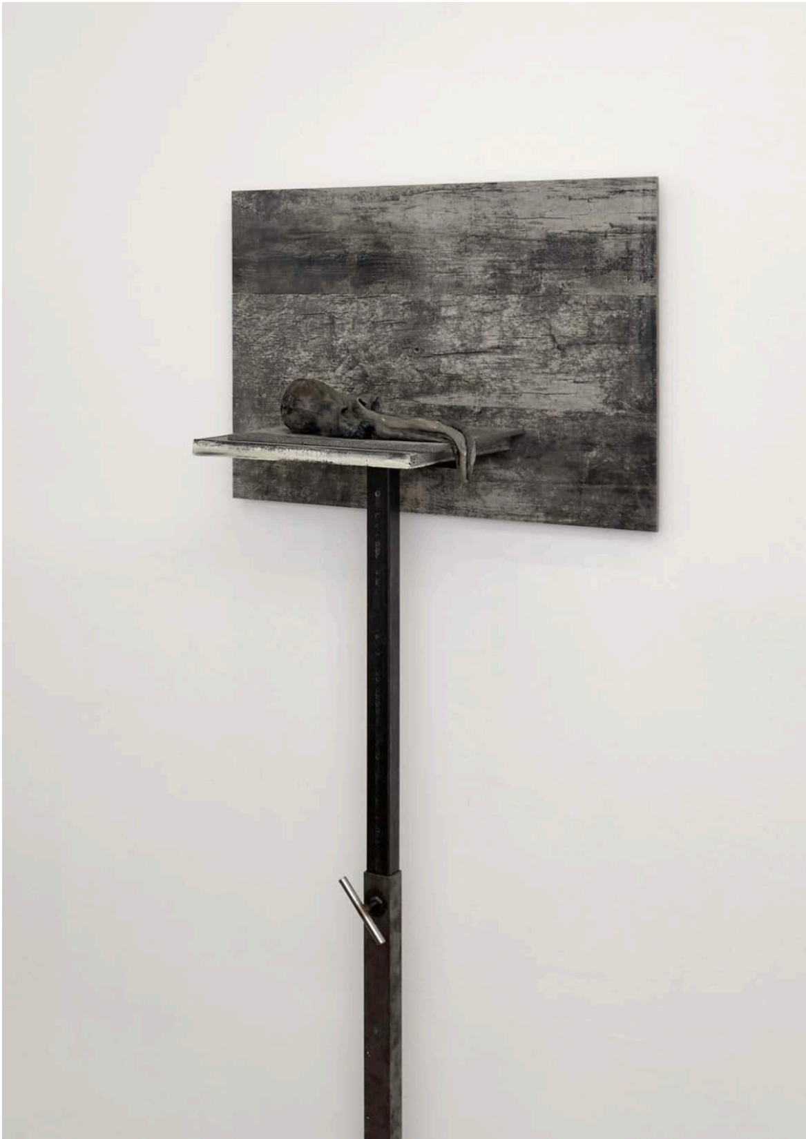
Toter Krake , 2023

Bienenwachs, Holz, Stahlgestell / beeswax, wood, steel rack