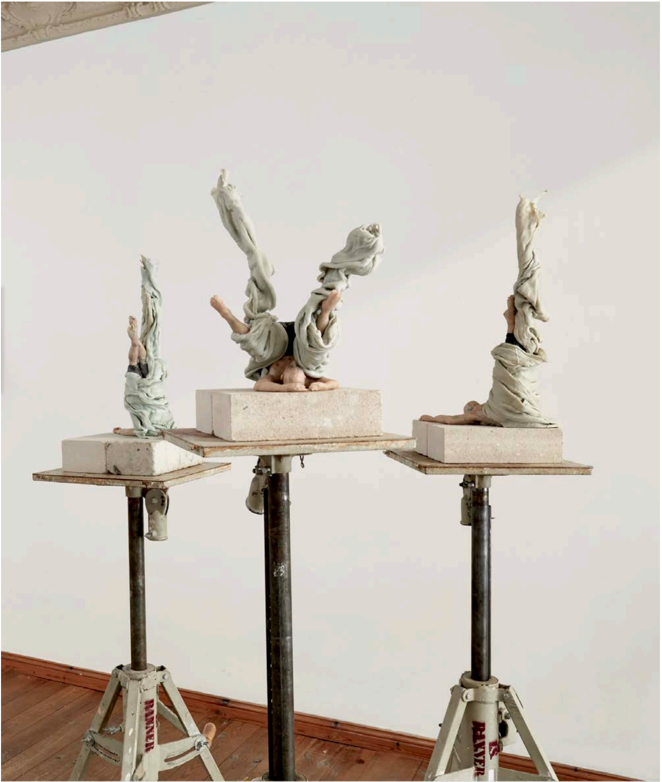
Abhebender I-III, 2023