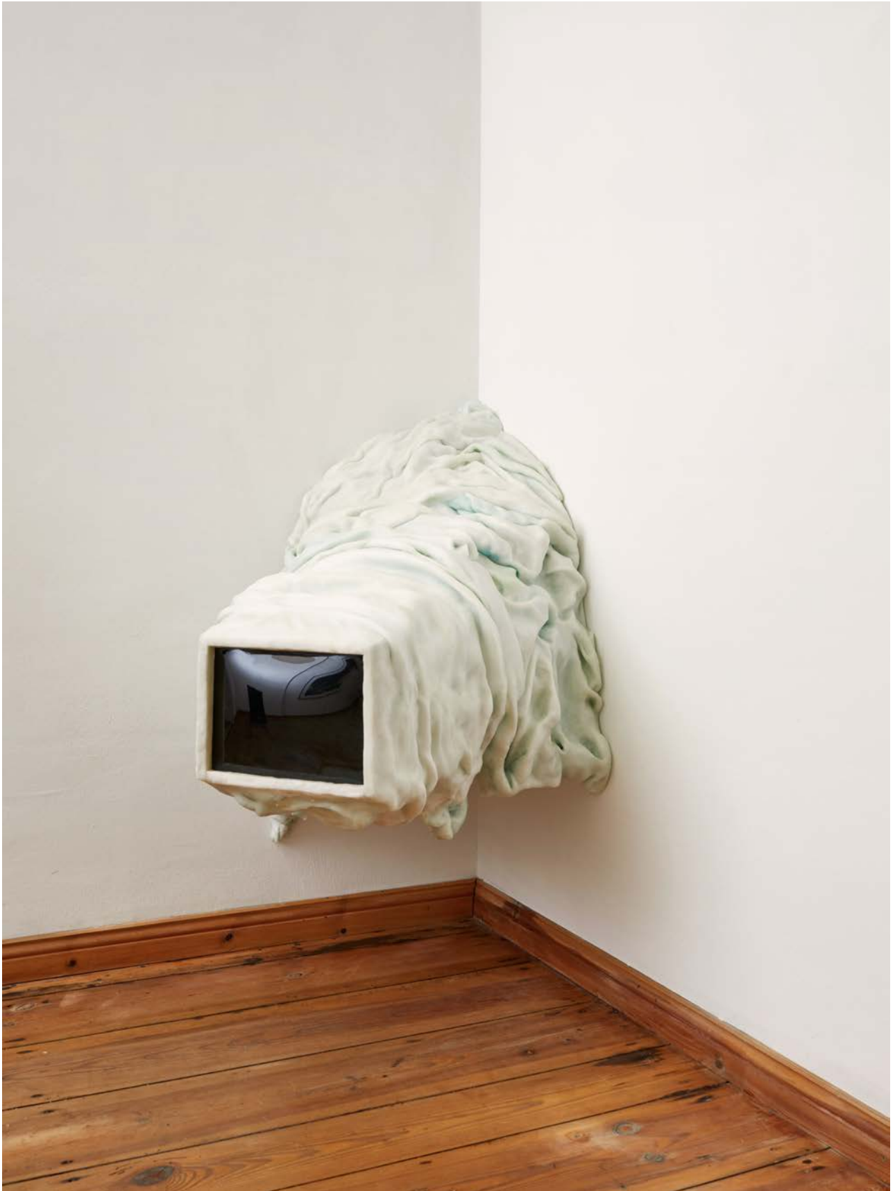
Wurm , 2023