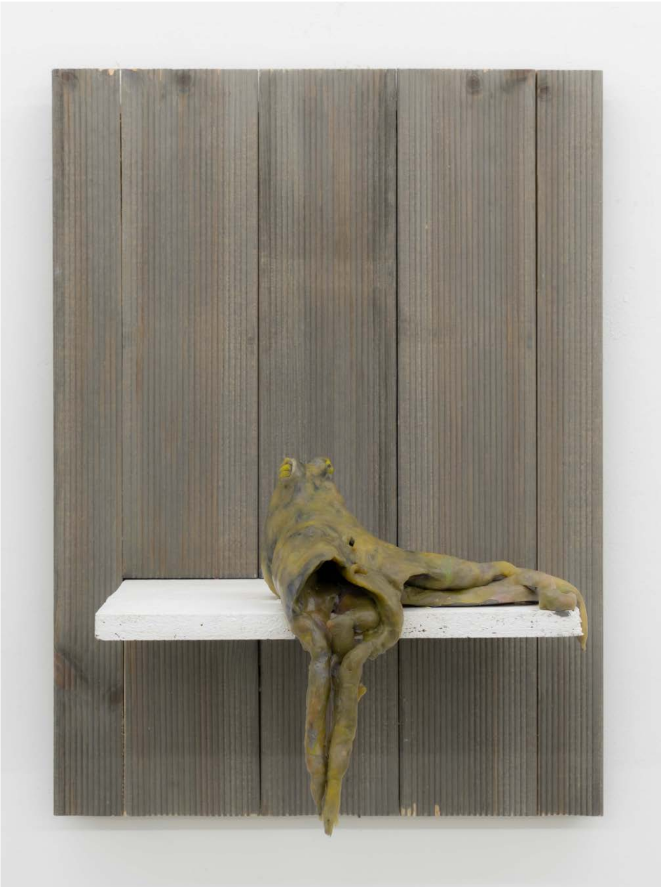
Grüner Krake , 2023