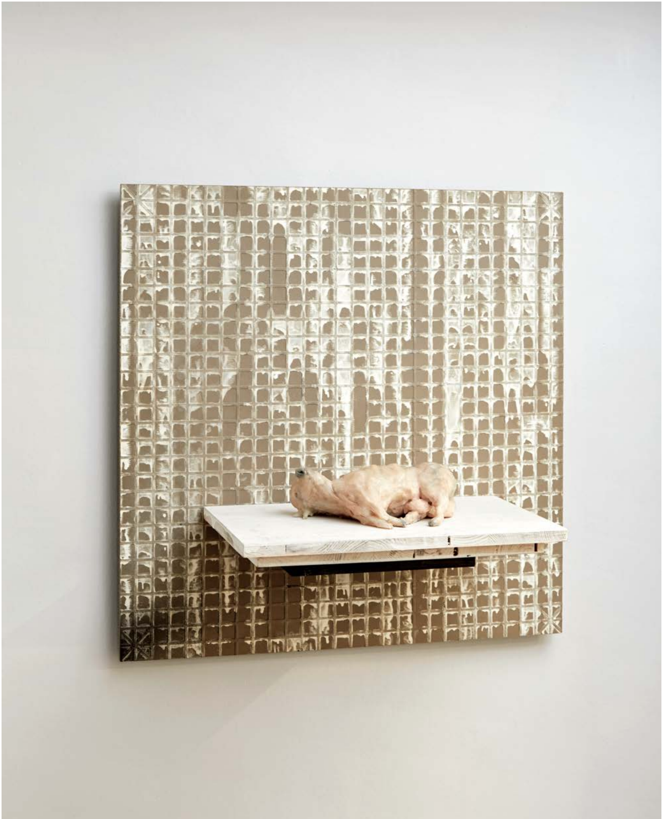
Liegende Kuh , 2023