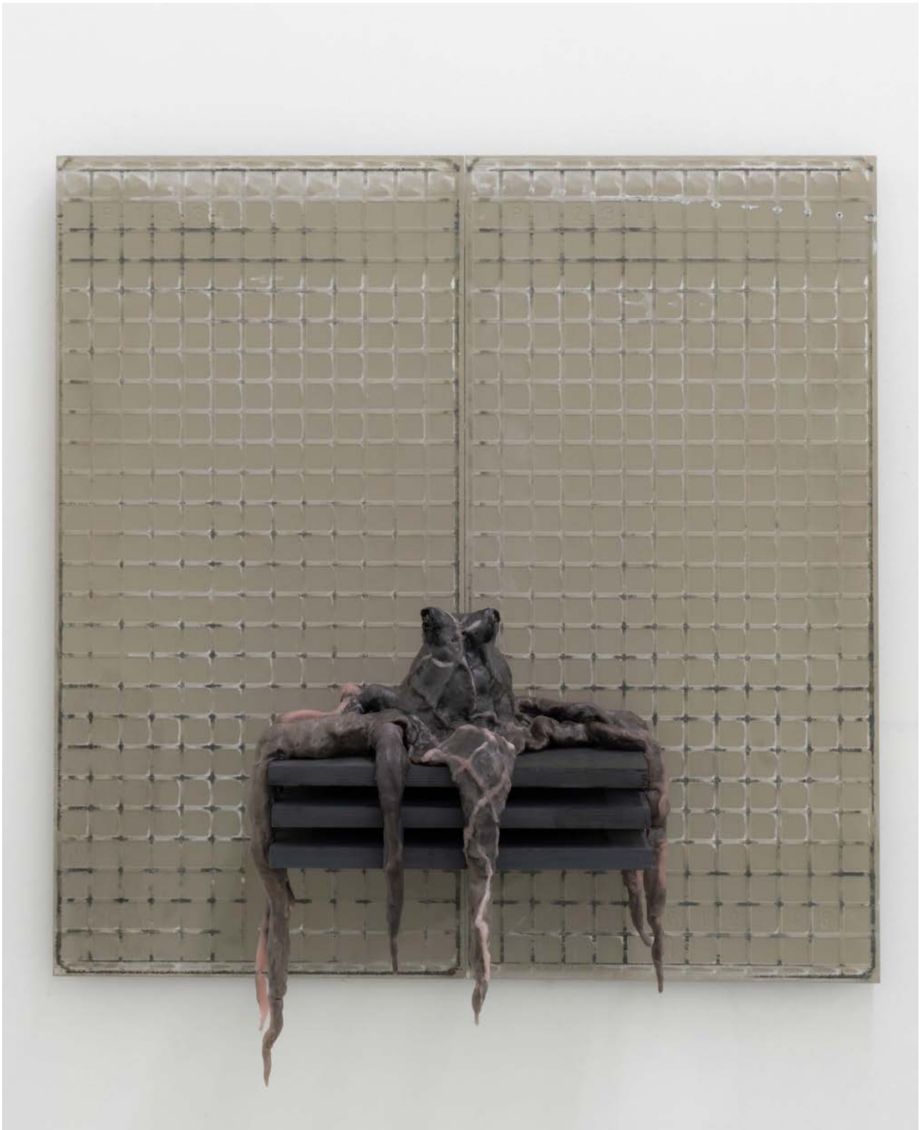
Grauer Krake vor Raster , 2023