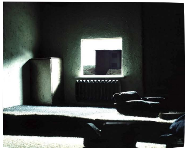
Haus 1 & 2 (Diptychon), 2009 Pigmentdruck / pigmented print 80 x 100 cm Auflage 5 ( last edition )