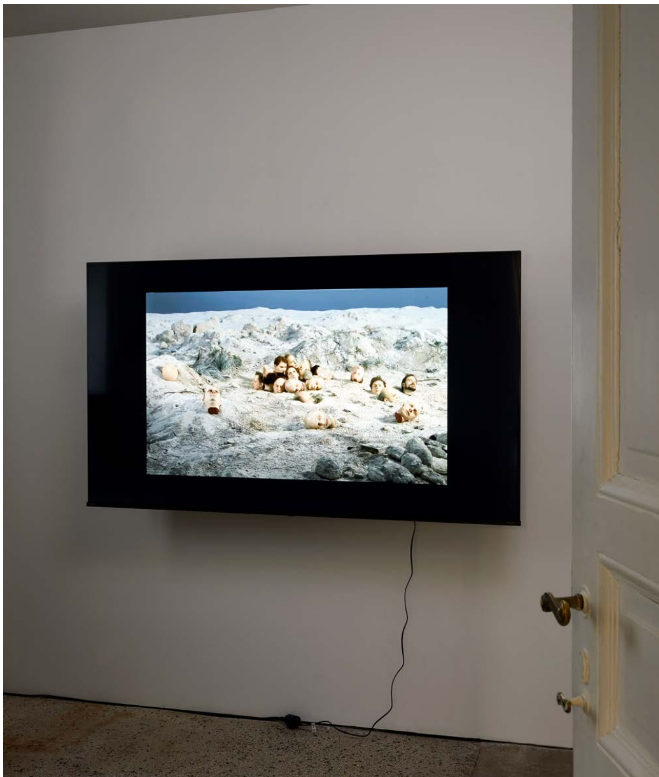
Ausstellungsansicht Exhibition view