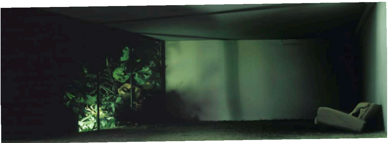
Garten II , 2008